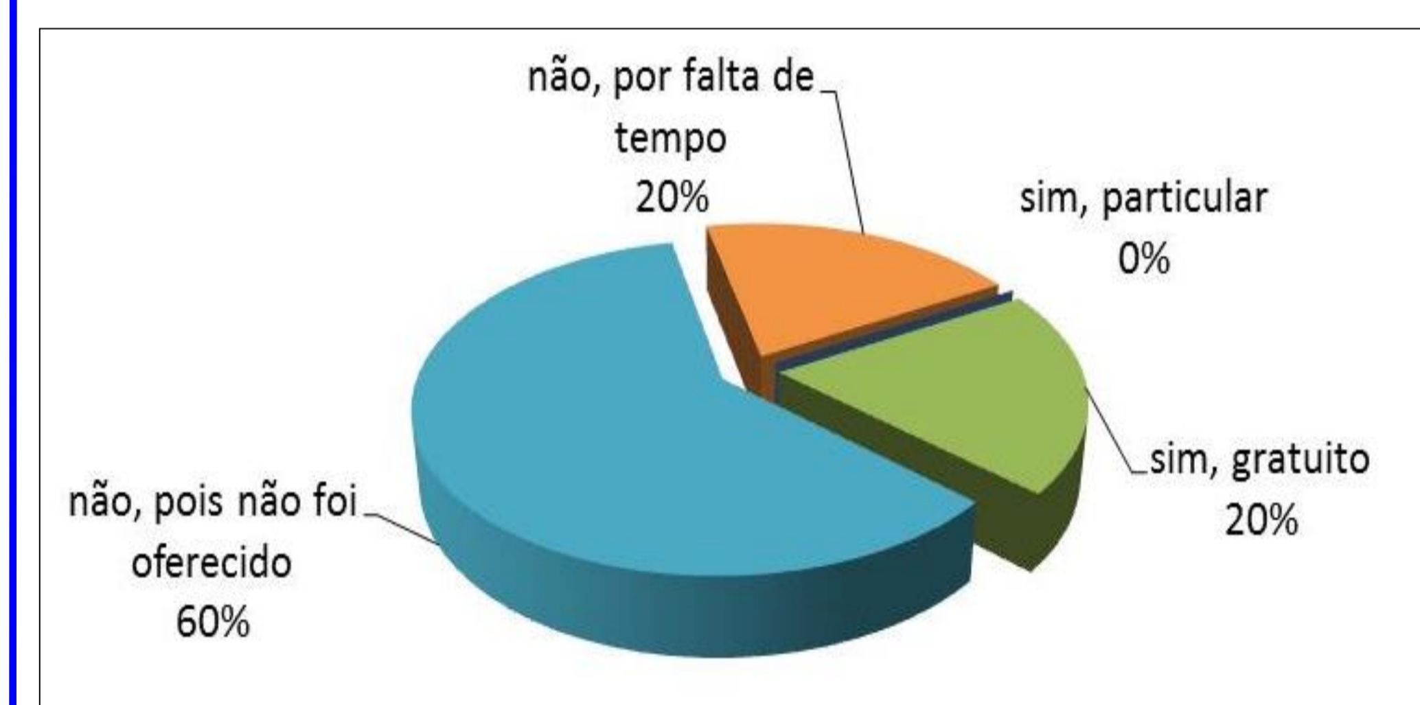
Figura 4. Quantidade de professores que participaram de cursos sobre o uso de tecnologias na educação.

A figura 4 apresenta o percentual de professores que afirmam ter participado de algum curso sobre o uso de tecnologias na educação, sendo que 60% dos entrevistados afirmam não ter participado por não ter sido oferecido pelo governo, 20% afirmam ter se envolvido em cursos do tipo, 20% não participaram por falta de tempo, e nenhum dos docentes consultados participou de cursos particulares sobre TICs na educação.