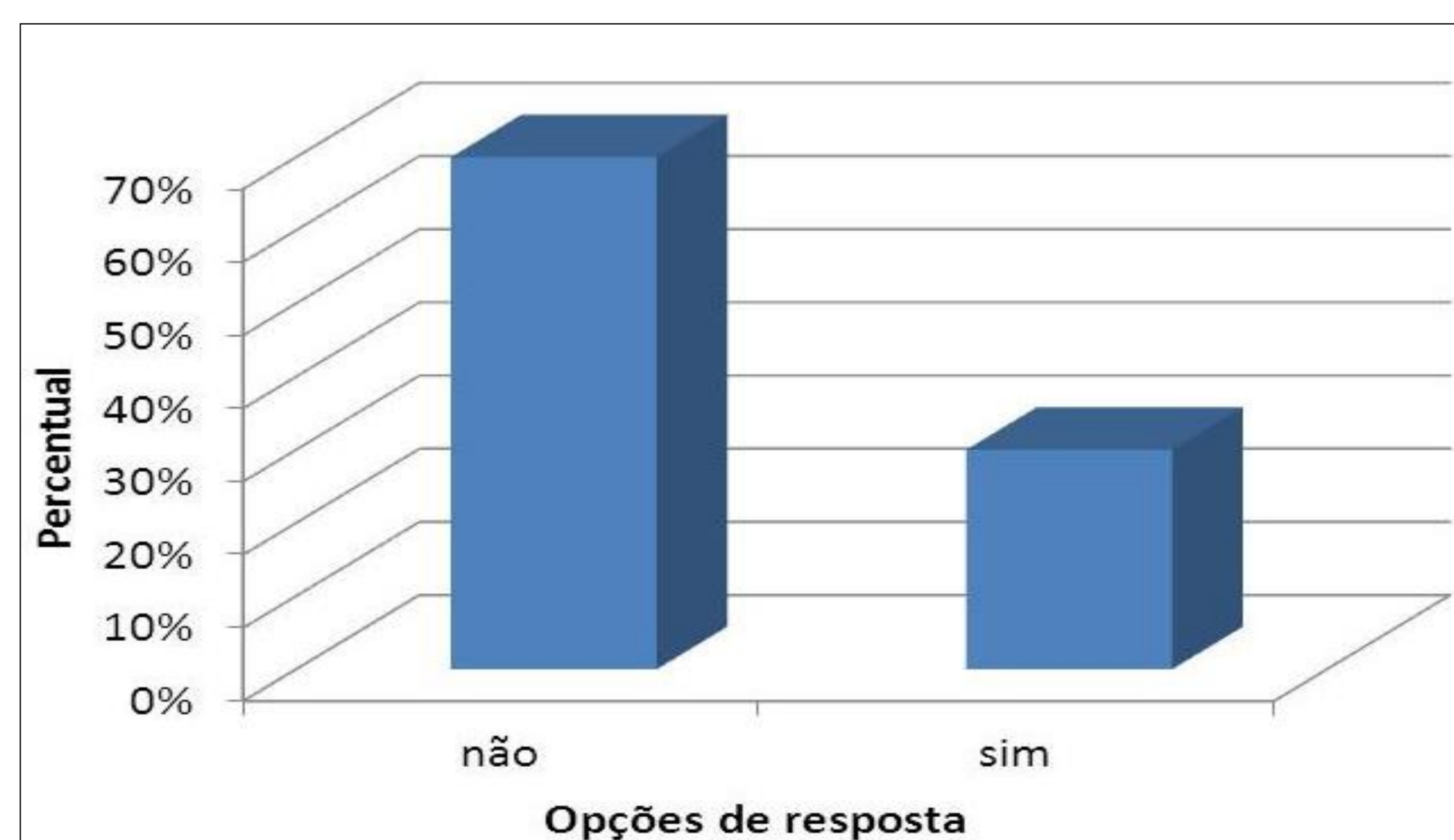
Figura 3. Conhecimento sobre jogos e softwares matemáticos.

Com a crescente utilização das novas tecnologias no campo educacional, existem vários softwares e jogos educativos sobre os diversos campos da matemática. Apesar desta grande variedade de opções, poucos professores conhecem estas ferramentas que podem transformar uma simples aula de matemática. De acordo com a figura 3, 70% dos docentes conhecem nenhum jogo ou software que pode ser utilizado nas aulas de matemática e 30% afirmam conhecer estes sistemas educacionais.