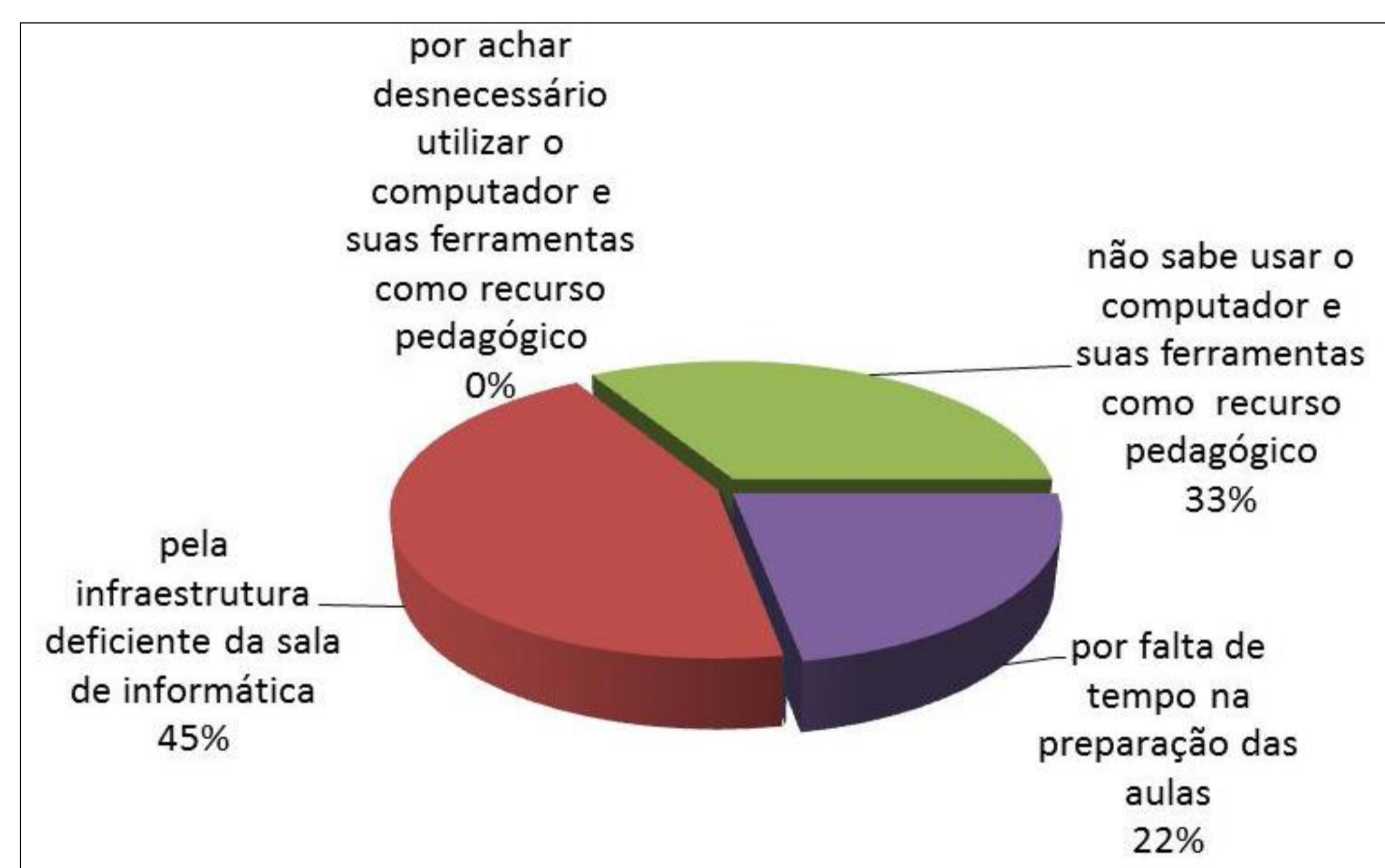
Figura 1. Motivos da não utilização do laboratório de informática nas aulas de matemática.

Muitos docentes precisam assumir esta postura. De acordo com a pesquisa, o que se percebe é que grande parte destes profissionais não tiveram durante o curso de graduação alguma disciplina específica que salientasse a importância, os benefícios e as possibilidades da tecnologia aplicada à educação. Dos docentes que responderam ao questionário, quanto aos conhecimentos de informática adquiridos no curso de graduação, observou-se que 11% dos entrevistados consideram excelente o conhecimento adquirido, 34% consideram bom, 11% consideram regular, 11% consideram ruim e 33% não tiveram nenhum tipo de conhecimentos de informática na graduação. Estes dados estão representados na figura 2.