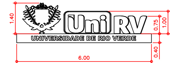
3 DETALHE 1 - VISTA FRONTAL Esc. 1:100