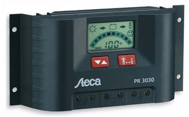
FIGURA 2: Controlador de carga