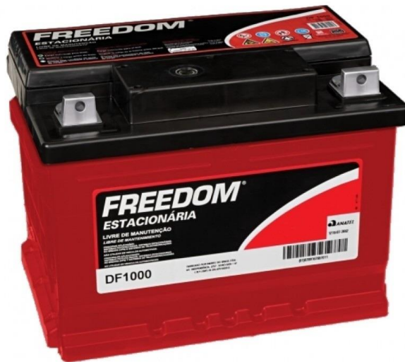
FIGURA 3: Bateria Estacionaria