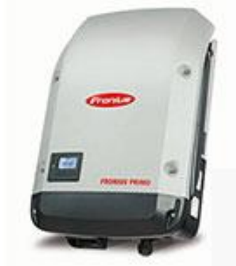
FIGURA 4: Inversor Grid-Tie